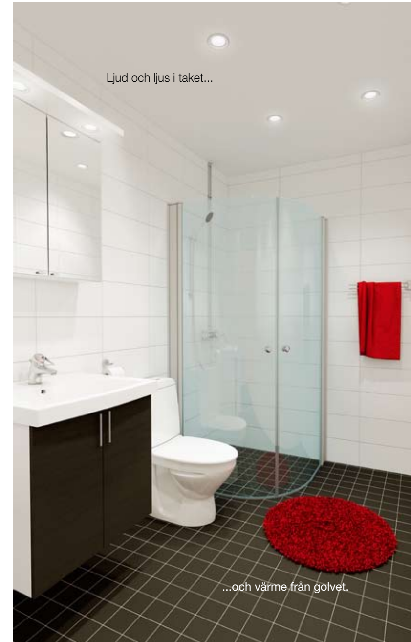
Bilden är en illustration. Avvikelse mot slutligt utförande kan förekomma.

Individuella skillnader samt ändringar kan förekomma.